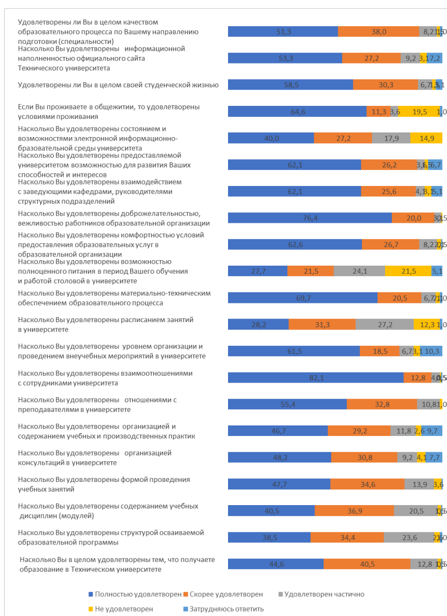
Рисунок 2 – Ответы обучающихся об удовлетворенности образовательной деятельностью, %